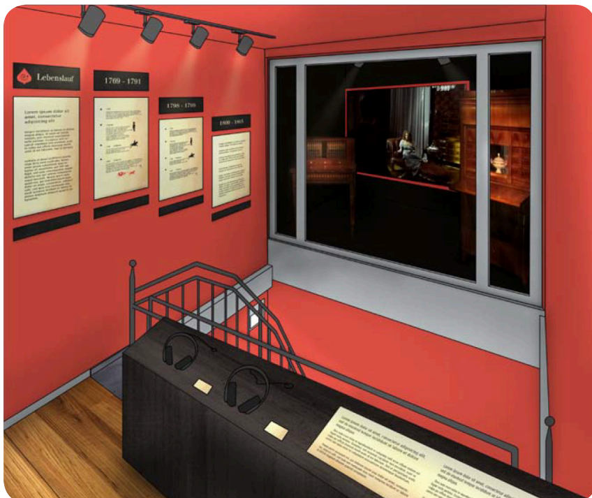
© Entwurf der Ausstellung „Dunkelgräfin“, Museum Hildburghausen von David Küffner 2016